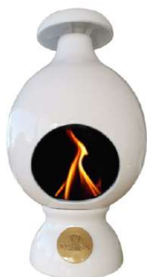
Eco Fireplaces mod. PICCOLO